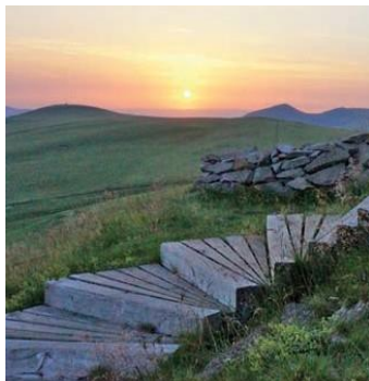
En montant à la Banne d'Ordanche

Magnifique point de vue sur la ville et ses alentours. Le départ se fait tout en haut du parc Fenestre. Durée : 2h30 aller/retour.