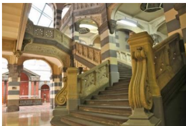
Les Thermes du Mont-Dore