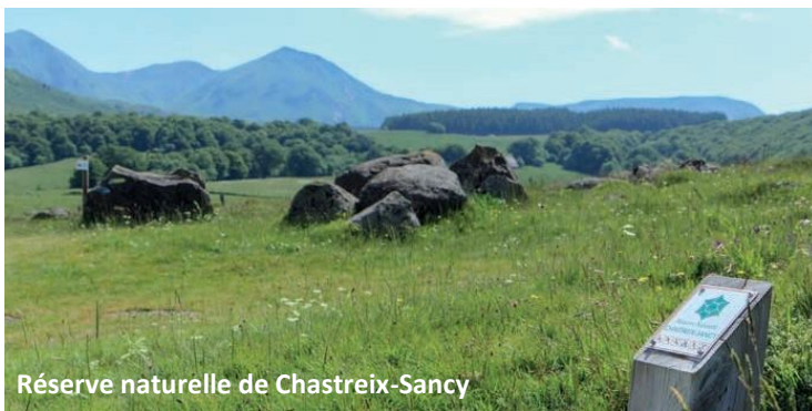
Réserve naturelle de Chastreix-Sancy