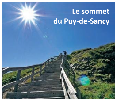
Le sommet du Puy-de-Sancy