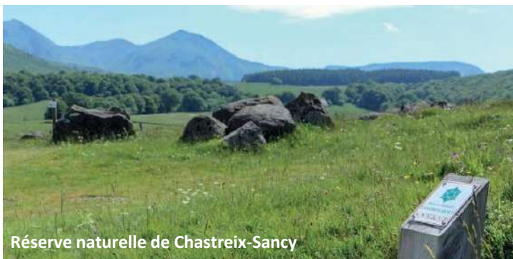
Réserve naturelle de Chastreix-Sancy