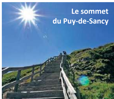
Le sommet du Puy-de-Sancy