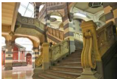
Les Thermes du Mont-Dore