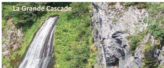
La Grande Cascade