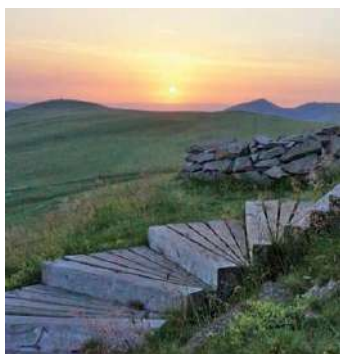
En montant à la Banne d'Ordanche

Magnifique point de vue sur la ville et ses alentours. Le départ se fait tout en haut du parc Fenestre. Durée : 2h30 aller/retour.